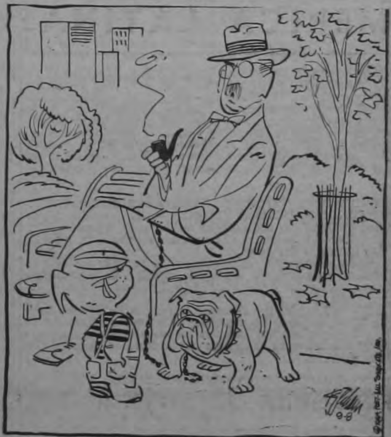
—Nadie lo pisó, señorito... Esa cara que tiene es natural...

(USIS)—Círculos comerciales en New York, han hecho saber que Cuba posiblemente dispondrá de su producción exportable de malezas durante 1955. Las malezas son residuos después de que el azúcar ha sido extraído, y que se usan como forraje y en la producción de alcohol industrial. Los vencedores creen que Cuba terminará con su sistema de dos precios para la exportación de productos de la caña de azúcar en el presente año, y que negociará una cantidad calculada en 120 millones de galones de la producción exportable a 7.80 centavos por galón.