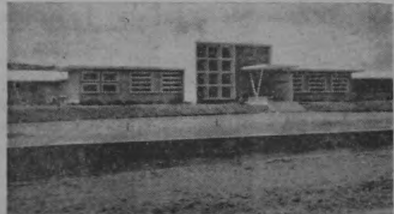
MODERNO HOSPITAL PARA SAN RAMON.—Apréciense en esta gráfica las líneas modernas del Hospital Carlos Luis Valverde que será inaugurado en San Ramón el día 1º de marzo, con motivo del 7º Aniversario de la muerte del preclaro médico. Dicho hospital cuenta con modernos aparatos científicos que lo catalogan como uno de los mejores del país. El costo de ese centro es de $2.000.000.00. A la inauguración asistirán los Ministros de Obras Públicas y de Seguridad don Francisco J. Orlich y don Rodrigo Loria Cortés.