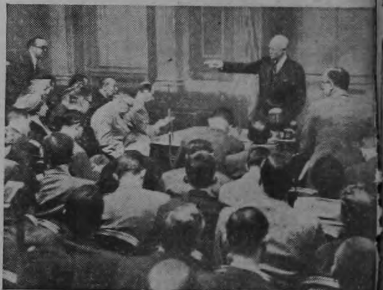
El Presidente Eisenhower en su conferencia semanal con los periodistas.